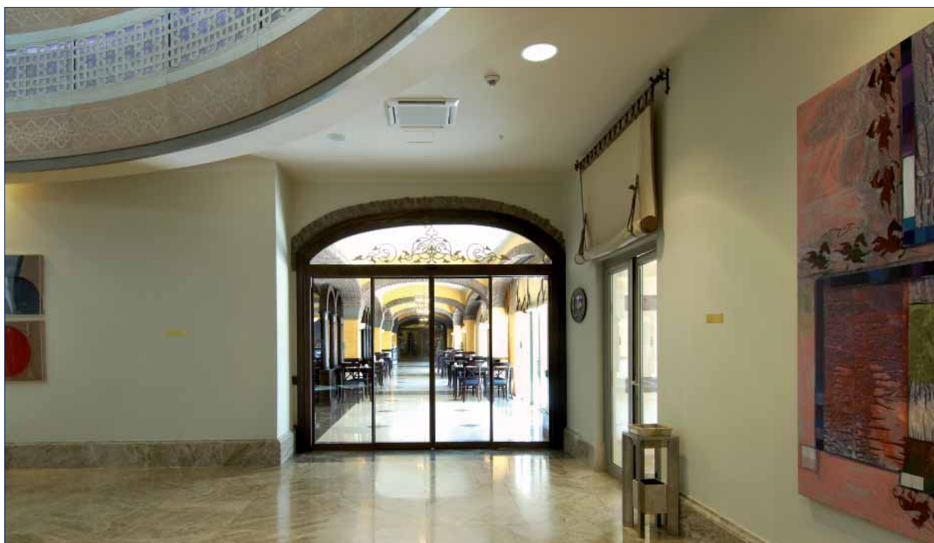
Hotel Kempinski, Antalya

Snažan motor 400 Ncm sa oklopljenim prenosnikom, nečujan.